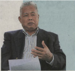
雇主联合会执行董事拿督三苏丁